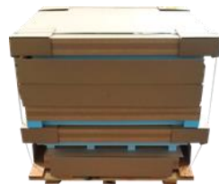
Quarter HPPS External dimensions when flat-packed: 1535 x 1275 x 1030 mm